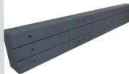
CRUZETA MACIÇA POLIMÉRICA