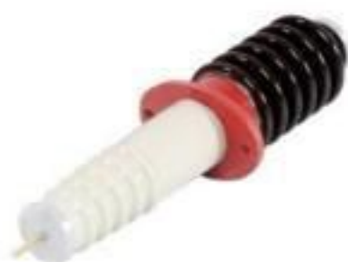
BUCHA DE PASSAGEM