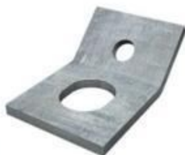
CHAPA DE ESTAI