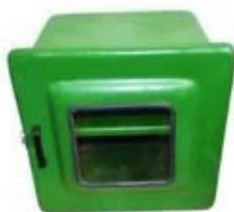
ARMARIO PORTA EPI