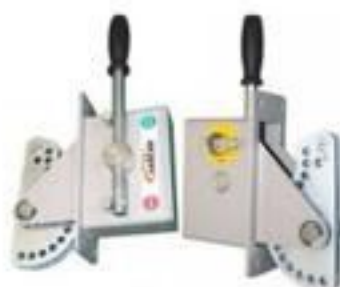
PUNHO DE MANOBRA