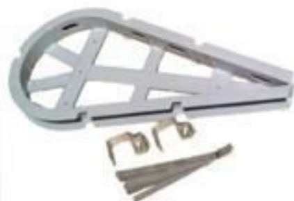
SUPORTE RESERVA TÉCNICA