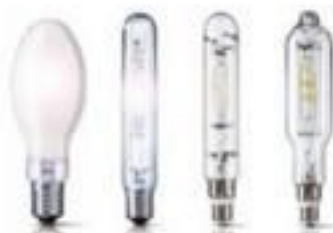
LAMPADA DE SÓDIO METÁLICA E LED