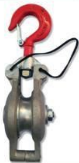
CARRETILHA PARA IÇAMENTO