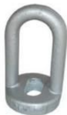
OLHAL P/ PARAFUSO