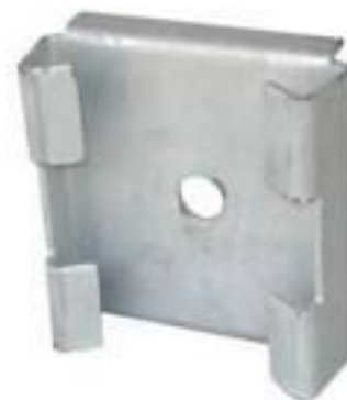
SELA PARA CRUZETA