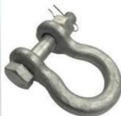
MANILHA CURVA 120KN