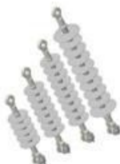
ISOLADOR ANCORAGEM POLIMÉRICO 15 A 36KV