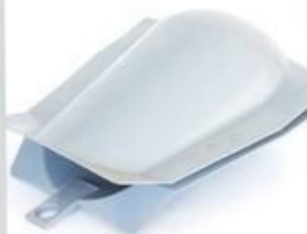
PROTETOR DE ESTRIBO E GRAMPO DE LINHA VIVA