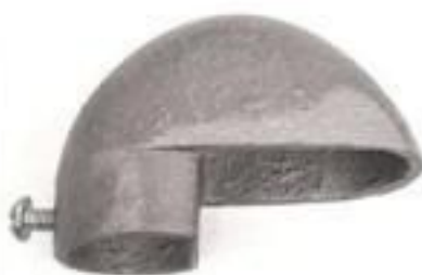
CABEÇOTE DE ALUMÍNIO E PVC