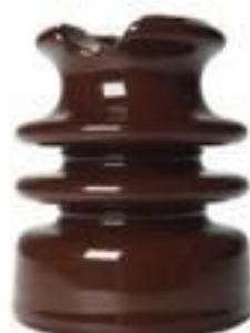
ISOLADOR PINO HIPTOP PORCELAMA