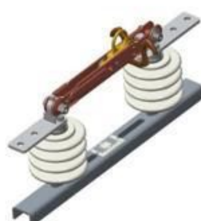
CHAVE SECCIONADORA UNIPOLAR PORCELANA 15 ATÉ 36KV