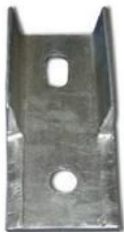
FIXADOR DE PERFIL U