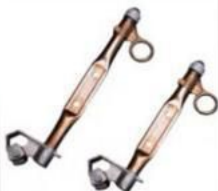
LÂMINA DESLIGADORA 15 ATÉ 35KV