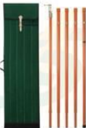
VARA DE MANOBRA E TELESCÓPICA