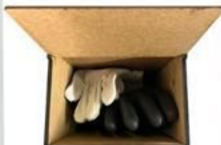
CAIXA DE MADEIRA PORTA LUVAS