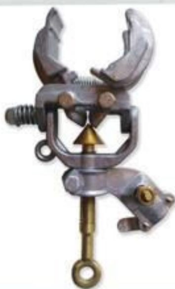
GRAMPO DE ATERRAM. MULTIANGULAR