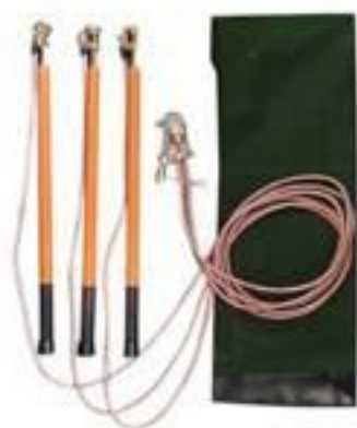
CONJUNTO DE ATERRAMENTO