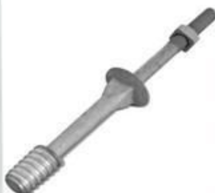
PINO CABEÇA DE CHUMBO