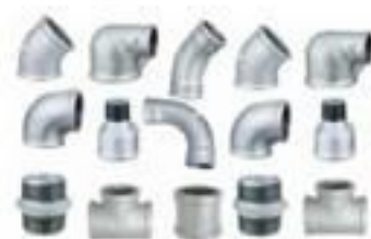
CONEXÕES PARA ELETRODUTO