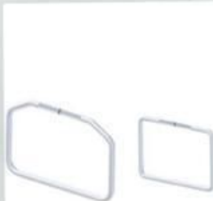
ALÇA DE ESTRIBO