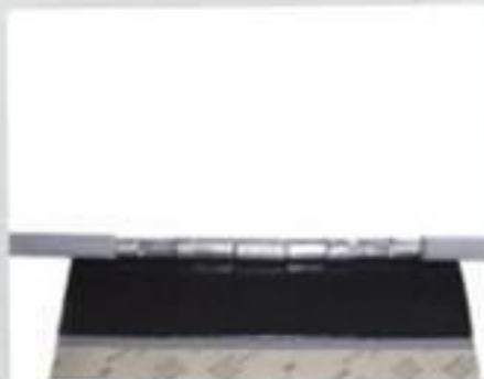
MANTA ISOLANTE 200X400