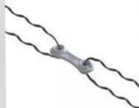
SECCIONADOR PREFORMADO CERCA LISO/FARPADO