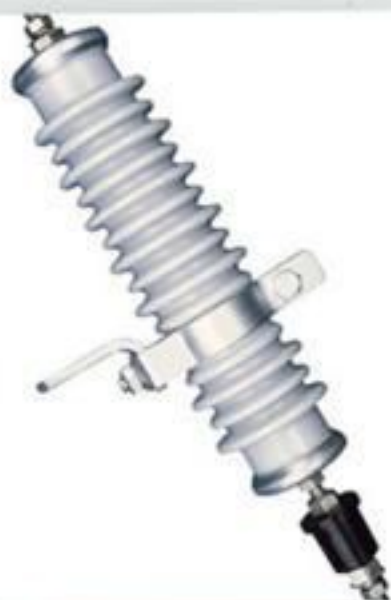
PARA RAIO PORCELANA