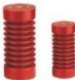
ISOLADOR PEDESTAL EPÓXI