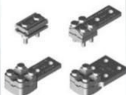
CONECTORES E TERMINAIS PARA CHAVE