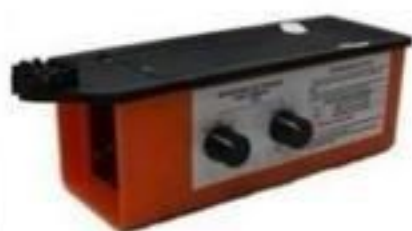
DETECTOR DE TENSÃO