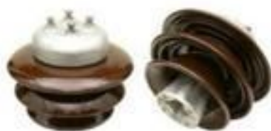
ISOLADOR PEDESTAL TR PORCELANA