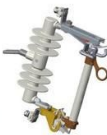
CHAVE FUSÍVEL BASE C POLIMÉRICA 15 ATÉ 36KV