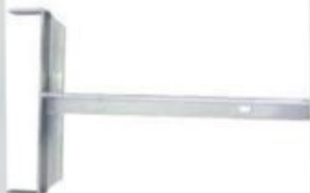
SUPOORTE PARA ESCADA