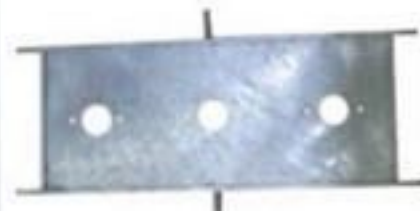
CHAPA DE PASSAGEM