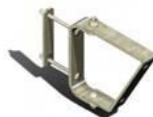
SUPORTE INCLINADO P/ CHAVE SECC.