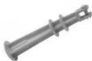
BRAÇO ANTI BALANÇO