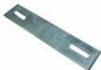
SUPORTE RETO P/CHAVE SECC.