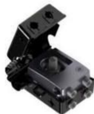
CONECTOR PERFURANTE 4 DERIVAÇÕES