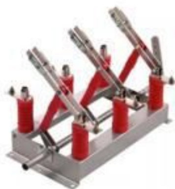
CHAVE SECCIONADORA TRIPOLAR