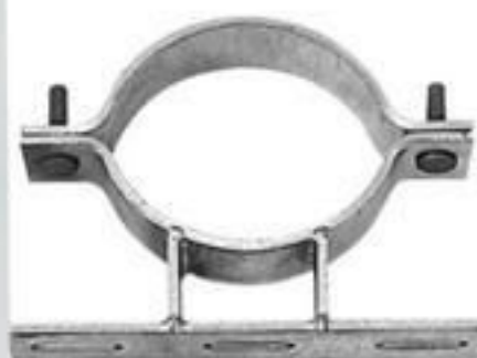
SUPORTE TRAF0 CIRCULAR