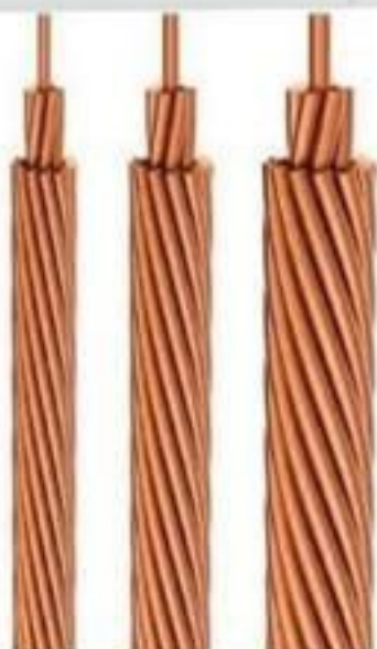
CABO DE COBRE NU