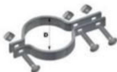
CINTA PARA ESCADA TIPO H