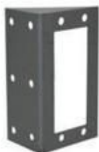
SUORTE PARA PUNHO DE MANOBRA