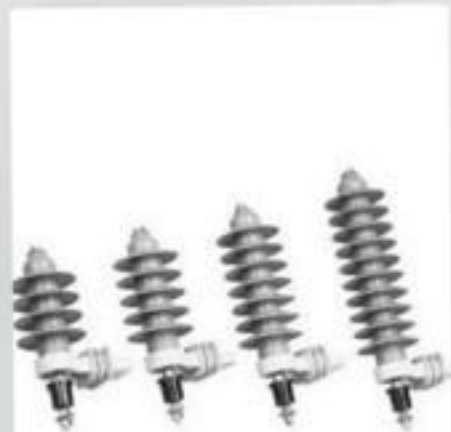
PARA RAIO POLIMÉRICO