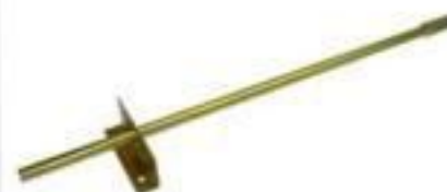
EIXO PROLONGADOR C/MANCAL