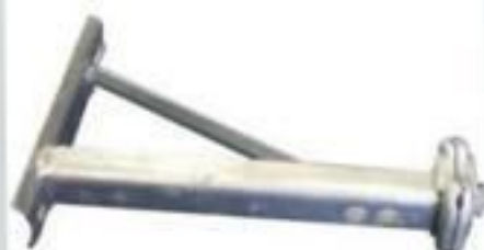
BRACO TIPO L 15 A 35KV