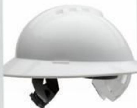
CAPACETE ABA TOTAL