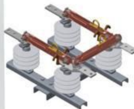
CHAVE BYPASS POLIMERICA 15 ATÉ 36KV