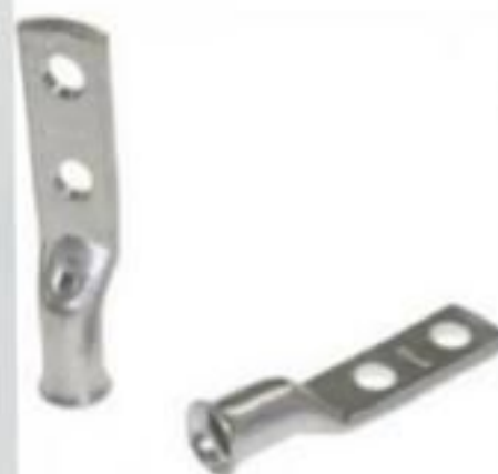
TERMINAL A COMPRESSÃO 2 FUROS