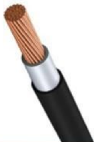
CABO DE COBRE COBERTO 15KV