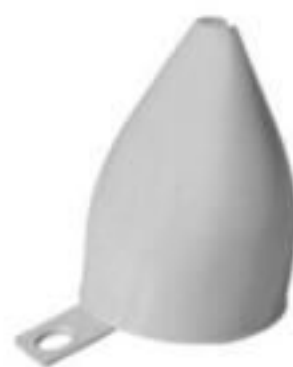
PROTETOR DE PARA RAIO MOVEL