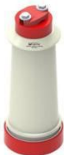
ISOLADOR PEDESTAL PORCELANA