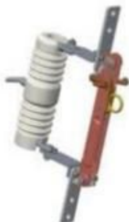
CHAVE SECCIONADORA COM LÂMINA PORCELANA