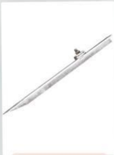
HASTE TERRA CANTONEIRA