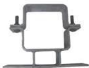
SUPORTE TRAF0 DUPL0 T