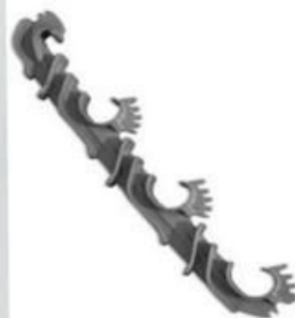
SEPARADOR VERTICAL DE FASES