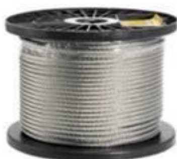
CORDOALHA DE AÇO