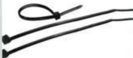
ABRAÇADEIRA DE NYLON