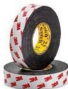
FITA DE AUTO FUSÃO