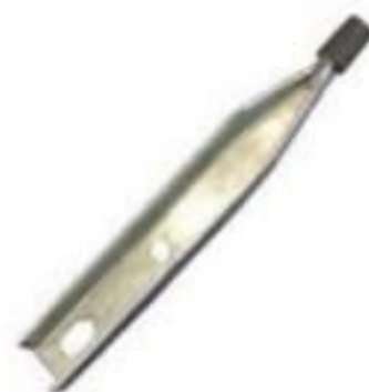
PINO DE TOPO