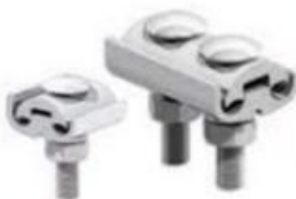
GRAMPO PARALELO DE ALUMINIO E COBRE