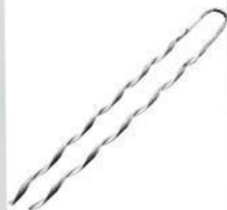
ALÇA PRÉ-FORMADA CABO COBERTO