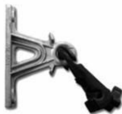
GRAMPO DE SUSPENSÃO