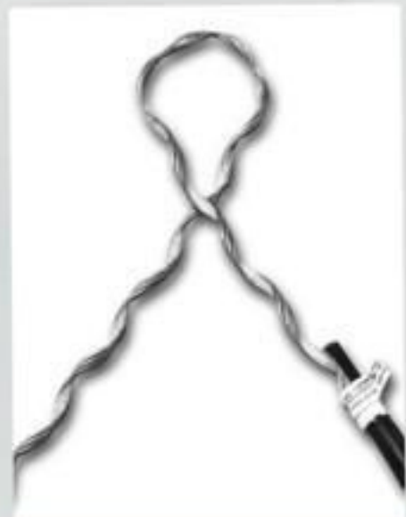
LAÇO PRÉ-FORMADO ROLDANA