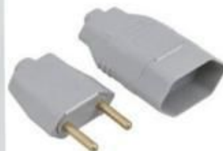
PLUG MACHO E FÊMEA