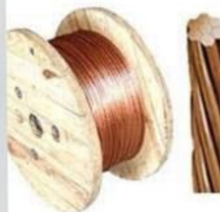
FIO DE COBRE NU