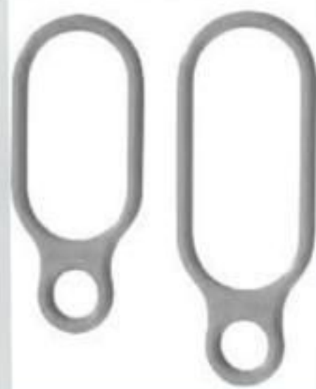
ANEL ELASTOMÉRICO PARA ESPAÇADOR E ISOLADOR