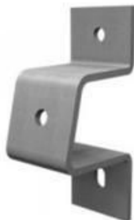
SUPOORTE AFASTADOR P/ ISOLADOR PILAR