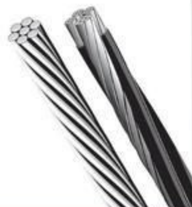
CABO DE ALUMÍNIO NU