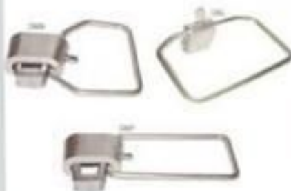
CONECTOR CUNHA COM ESTRIBO