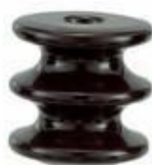
ISOLADOR ROLDANA 2 LEITOS