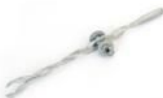
ALÇA PRÉ-FORMADA OLHAL DISTRIBUIÇÃO