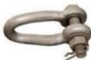
MANILHA TORCIDA 120KN