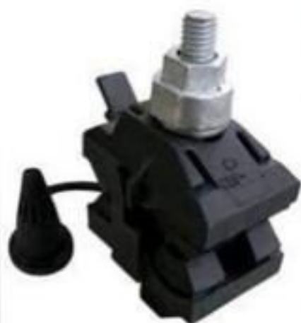
CONECTOR PERFURANTE TIPO CDP