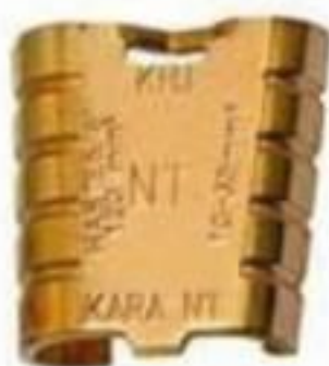
CONECTOR CUNHA ATERRAMENTO