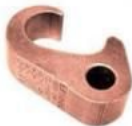
CONECTOR DE ATERRAMENTO