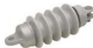
ISOLADOR BASTÃO PORCELANA