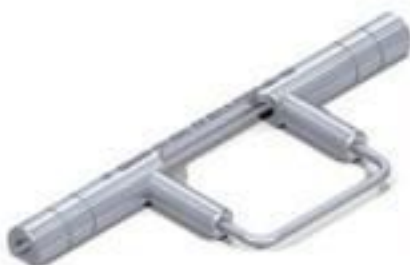
LUVA DE ESTRIBO