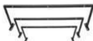
SUPORTE PARA MUFLA E PARA RAI0