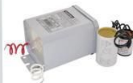
REATOR VAPOR SÓDIO METÁLICO