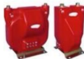
TRANSFORMADOR DE POTENCIAL E DE CORRENTE