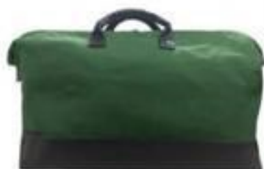
BOLSA E BALDE DE LONA