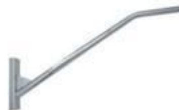
BRAÇO DE ILUMINAÇÃO PUBLICA