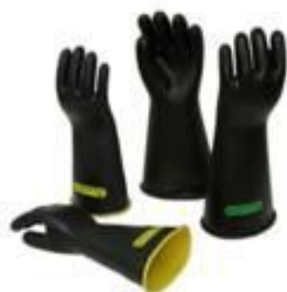
LUA DE BORRACHA ISOLANTE