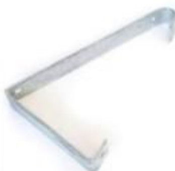
SUPORTE INCLINADO P/CH FACA/BYPASS