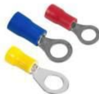
TERMINAL PRÉ ISOLADO