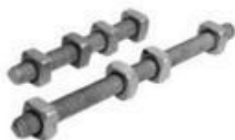
PARAFUSO ROSCA DUPLA