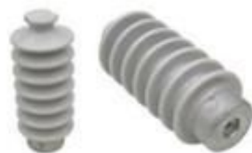
ISOLADOR PILAR PORCELANA