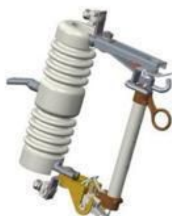
CHAVE FUSÍVEL BASE C PORCELANA 15 A 36KV