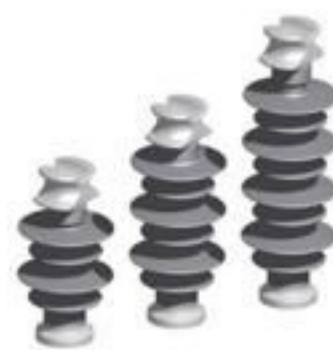
ISOLADOR PILAR POLIMÉRICO