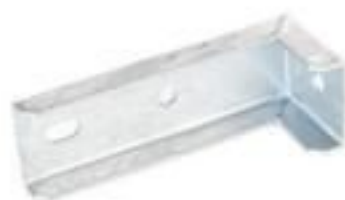
SUPOORTE PARA ISOLADOR PILAR