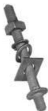
PINO AUTO TRAVANTE