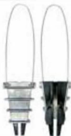
GRAMPO DE ANCORAGEM