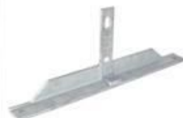
SUPORTE TIPO T 15 A 35KV