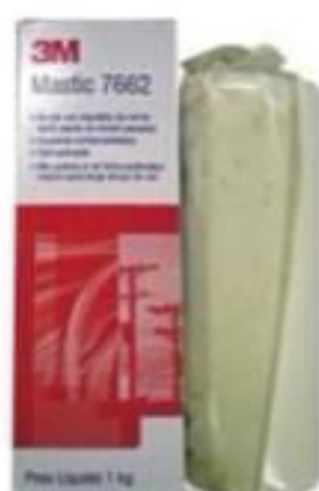
MASSA DE CALAFETAR