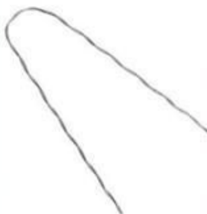
ALÇA PRÉ-FORMADA SERVIÇO