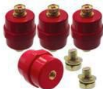
ISOLADOR EM EPÓXI