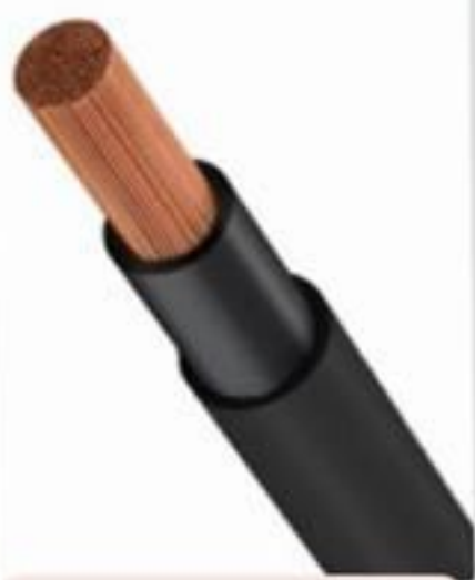
CABO DE COBRE FLEX