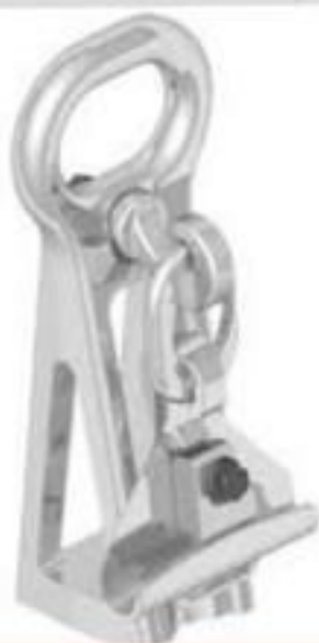
SUPORTE PARA GRAMPO DE SUSPENSÃO