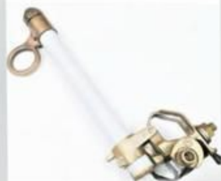
PORTA FUSIVEL 15 ATÉ 36KV