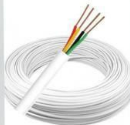
CABO DE TELEFONIA