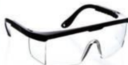
ÓCULOS DE PROTEÇÃO