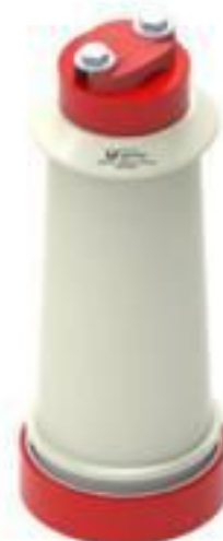
ISOLADOR PEDESTAL PORCELANA