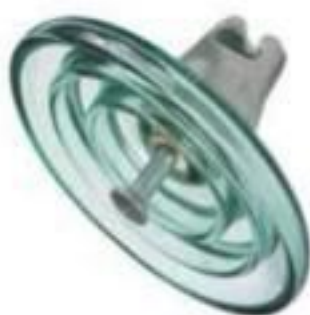
ISOLADOR DISCO VIDRO