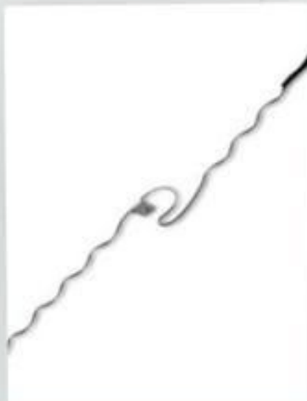
LAÇO PRÉ-FORMADO TOPO