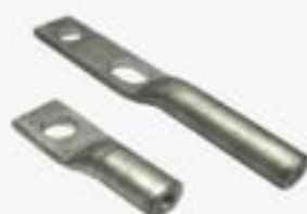
TERMINAL DE ALUMÍNIO EXTRUDADO 1 E 2 FUROS