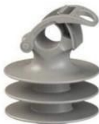
ISOLADOR PINO POLIMÉRICO C/TRAVA