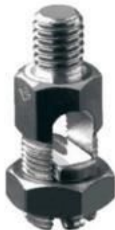
CONECTOR SPLIT BOLT