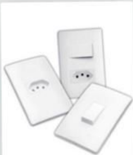
TOMADA E ESPELHO