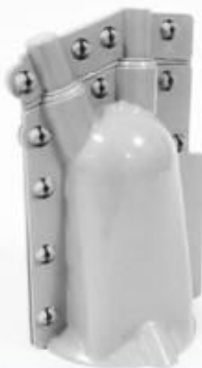
PROTETOR DE BUCHA E PARA RAI0 2 SAÍDAS