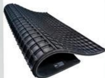
TAPETE DE BORRACHA ISOLANTE