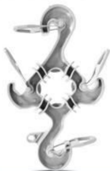
ESPAÇADOR LOSANGULAR COM TRAVA