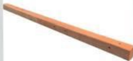
CRUZETA DE MADEIRA