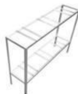
CAVALETE DE MEDIÇÃO