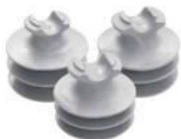
ISOLADOR DE PINO POLIMÉRICO