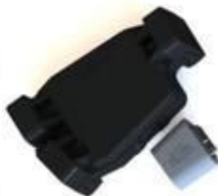
CAPA PROTETORA GRANDE PARA CONECTOR CUNHA