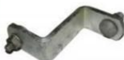
SUPOORTE TIPO Z