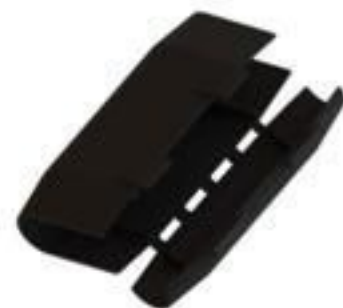
CAPA PROTETORA PEQUENA PARA CUNHA