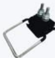
CONECTOR PERFURANTE COM ESTRIBO