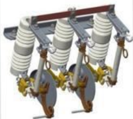
CHAVE RELIGADORA PORCELANA 15 A 36KV