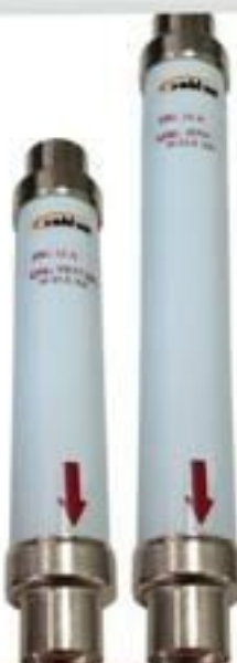
FUSIVEL LIMITADOR HH