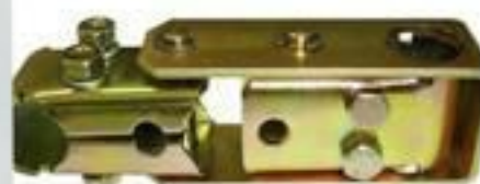
ALAVANCA ARTICULADA PARA PUNHO