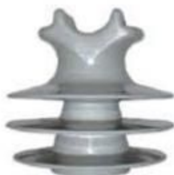
ISOLADOR PINO POLIMÉRICO