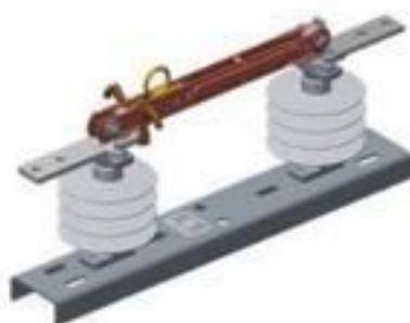
CHAVE SECCIONADORA UNIPOLAR POLIMERICA