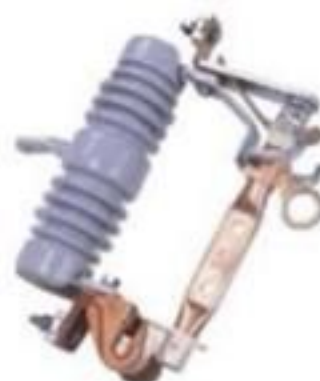
CHAVE FUSIVEL BASE C COM LÂMINA 15 ATÉ 36KV