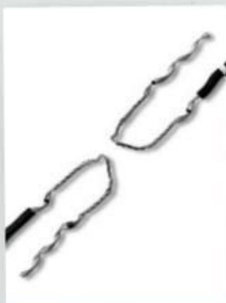
LAÇO PRÉ-FORMADO DUPLO LATERAL