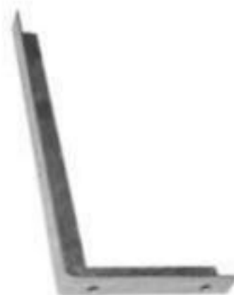
SUPOORTE HORIZONTAL 675MM