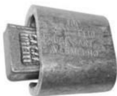
CONECTOR CUNHA ALUMÍNIO