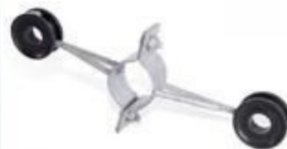
ISOLADOR PARA MASTRO