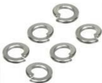
ARRUELA DE PRESSÃO