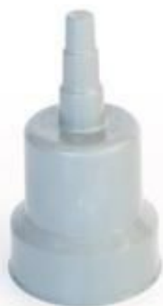
PROTETOR DE BUCHA E PARA RAI0 1 SAÍDA