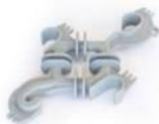
ESPAÇADOR LOSANGULAR SEM TRAVA