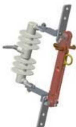
CHAVE SECCIONADORA COM LAMINA POLIMÉRICA