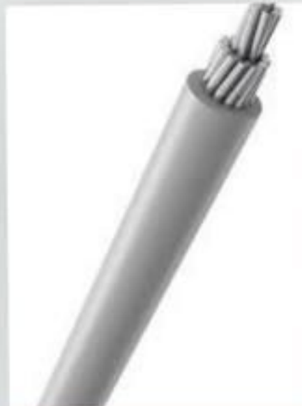
CABO DE ALUMÍNIO PROTEGIDO XLPE 15 A 36KV