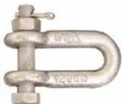
MANILHA RETA 120KN