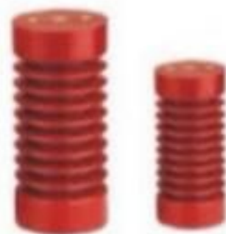
ISOLADOR PEDESTAL EPÓXI