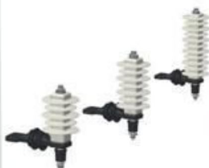
PARA RAI0 POLIMÉRICO 12 ATÉ 36KV