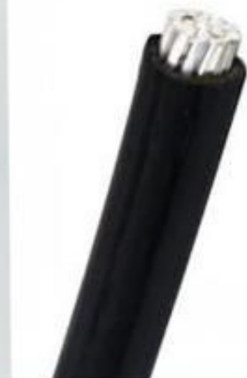
CABO DE ALUMÍNIO PROTEGIDO 1KV