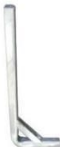
SUPOORTE AFASTADOR HORIZONTAL 15/35KV