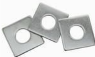
ARRUELA QUADRADA E REDONDA