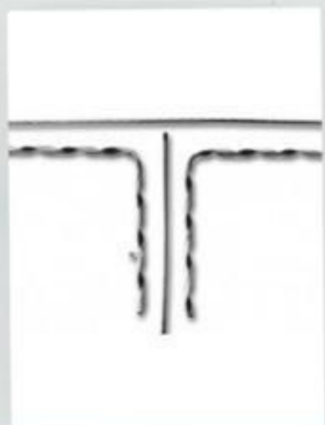
LAÇO PRÉ-FORMADO LATERAL