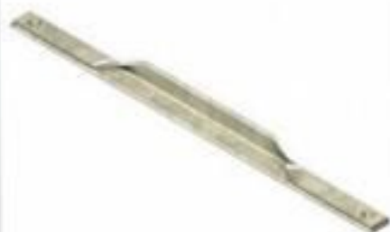
MÃO FRANCESA PERFILADA