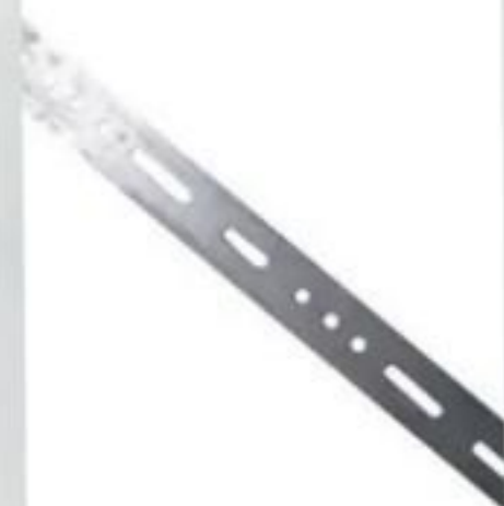
CRUZETA DE AÇO