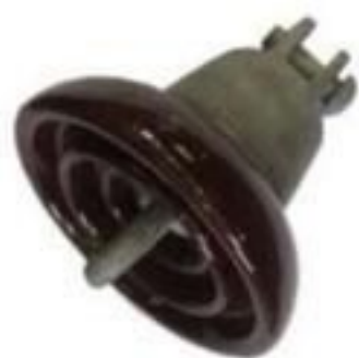
ISOLADOR DISCO PORCELANA