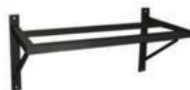
SUORTE FIXAÇÃO DE TP E TC