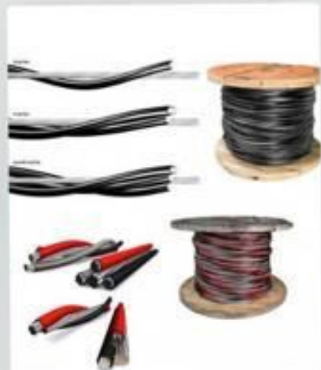
CABO MULTIPLEX NEUTRO NU E ISOLADO