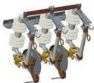
CHAVE RELIGADORA POLIMÉRICA 15 A 36KV