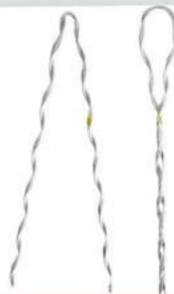
ALÇA PRÉ-FORMADA CABO DE AÇO