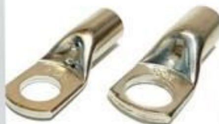
TERMINAL A COMPRESSÃO 1 FURO