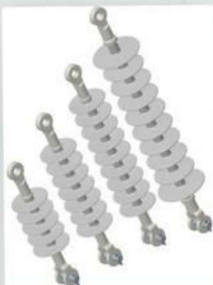
ISOLADOR ANCORAGEM POLIMERICO