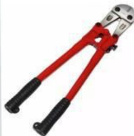
ALICATE CORTA VERGALHÃO