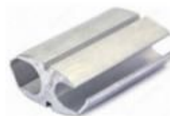
CONECTOR A COMPRESSÃO TIPO H