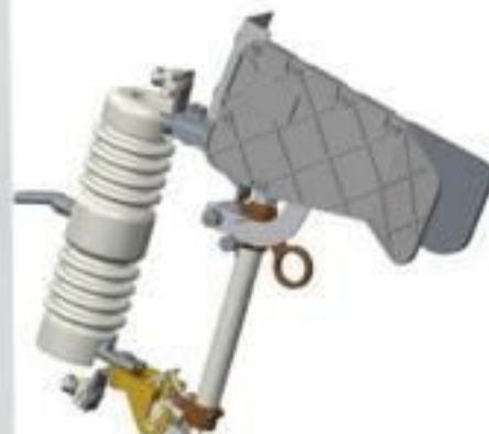
CHAVE FUSIVEL BASE C COM CARGA