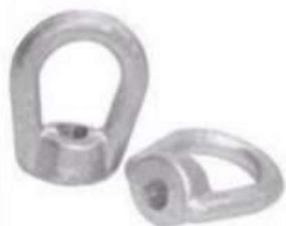
PORCA OLHAL M16 / M12