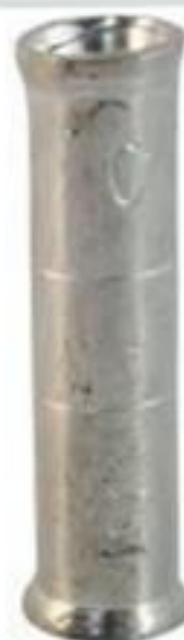
LUVA DE EMENDA A COMPRESSÃO