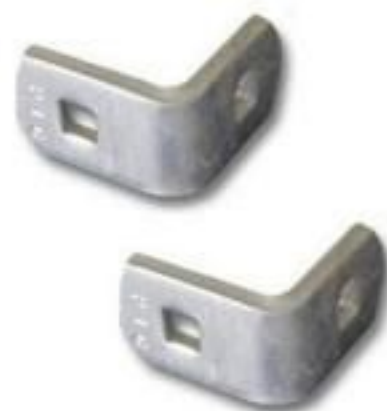
CANTONEIRA RETA P/ BRAÇO TIPO C