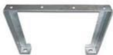
SUPOORTE AFASTADOR DE REDE