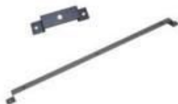
SUPORTE PARA ISOLADOR PEDESTAL