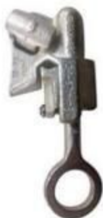
GRAMPO DE LINHA VIVA