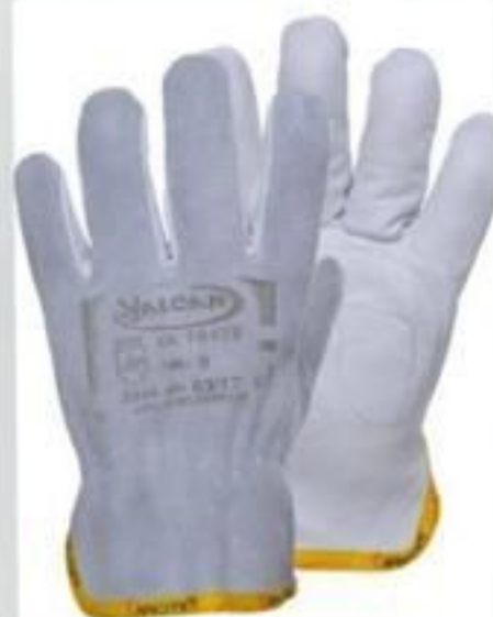
LUVA DE VAQUETA