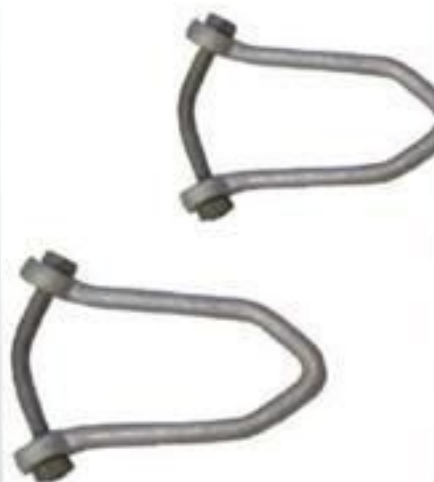
SUPORTE PARA ISOLADOR CASTANHA