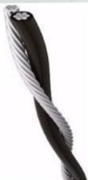
CABO DE ALUMÍNIO FLEXIVEL