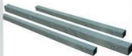
CRUZETA FIBRA DE VIDRO