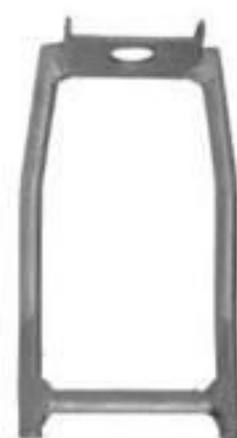
ESTRIBO PARA BRAÇO TIPO L