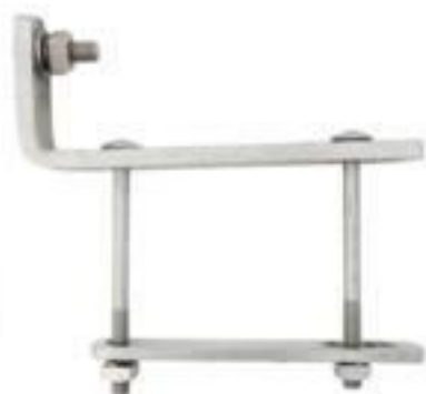
SUPOORTE L P/ CHAVE E PARA RAO