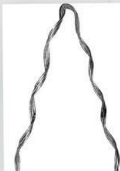
ALÇA PRÉ-FORMADA DISTRIBUIÇÃO