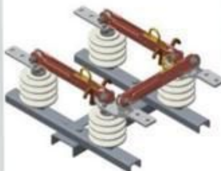
CHAVE BYPASS PORCELANA 15 ATÉ 36KV