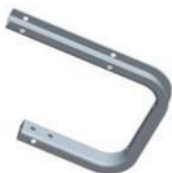
BRACO TIPO C 15 A 35KV