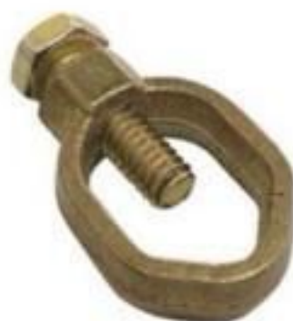
CONECTOR PARA HASTE TERRA